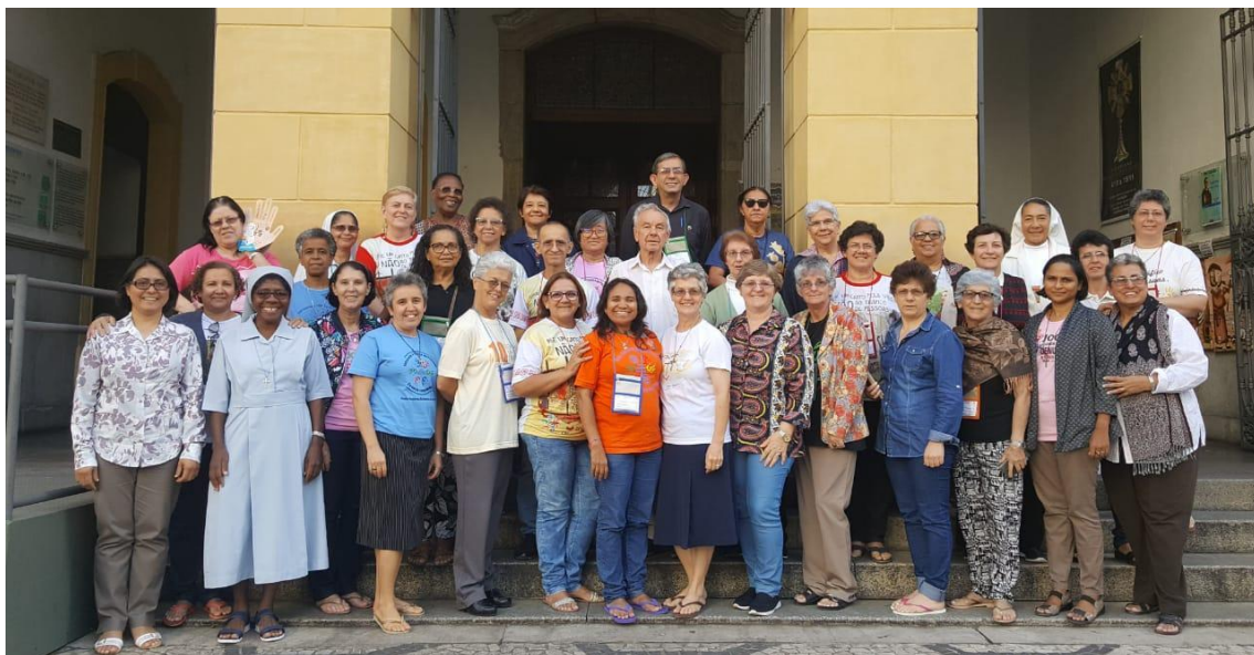
Grupo das/dos Referenciais Regionais e dos Núcleos que participaram do Encontro.