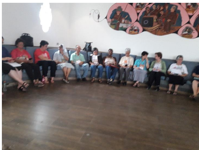
Alguns momentos do Encontro