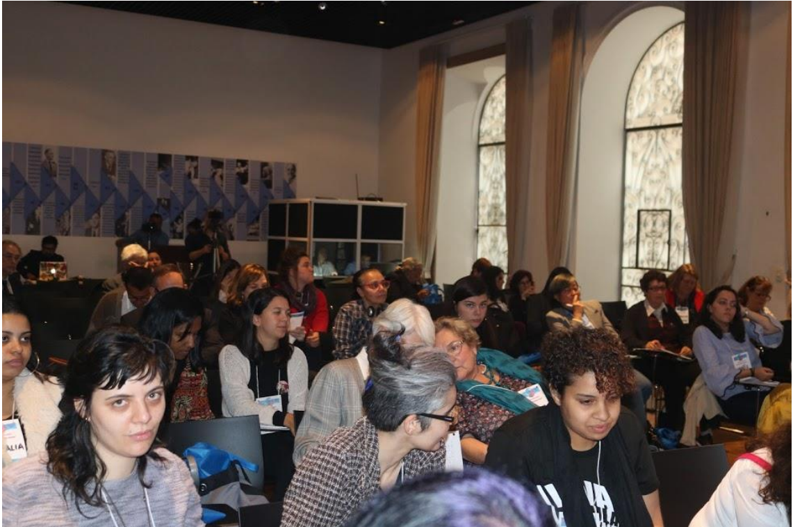
PARTICIPANTES DO ENCONTRO